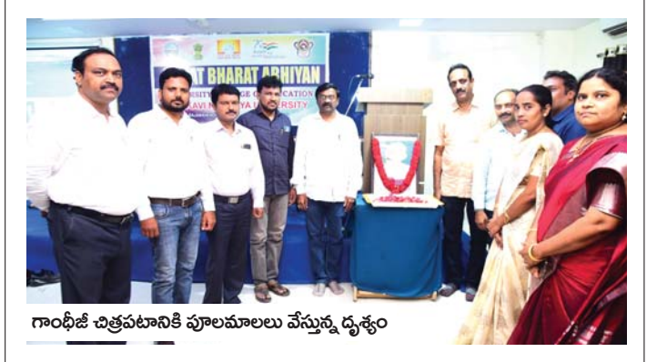
గాంధీజీ చిత్రపటానికి పూలమాలలు వేస్తున్న దృశ్యం